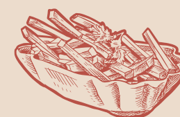
BAKJE VERSE FRIET EXTRA 🥕 soja, gluten, selderij

DE HOOFDGERECHTEN WORDEN STANDAARD GESERVEERD MET VERSE FRIET LOS BIJ TE BESTELLEN: SCHAALTJE SALADE